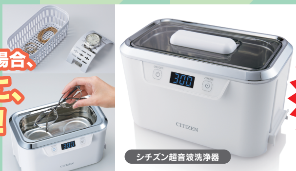
シチズン超音波洗浄器

※ご紹介者様は、当JAにて年金をお受取り いただいている方に限らせていただきます。